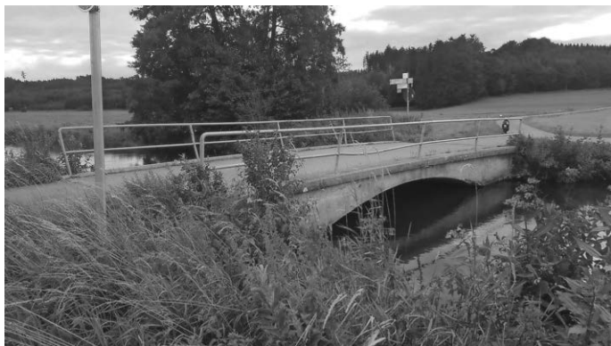
Die Brücke bei Niedernzell / Weitenbühl / Huggenlaubach wird in den kommenden Monaten erneuert.

Während dieser Bauphase ist die Straße gesperrt. Wir bitten alle Verkehrsteilnehmer um Beachtung. Eine Umleitungsstrecke wird ausgeschildert.