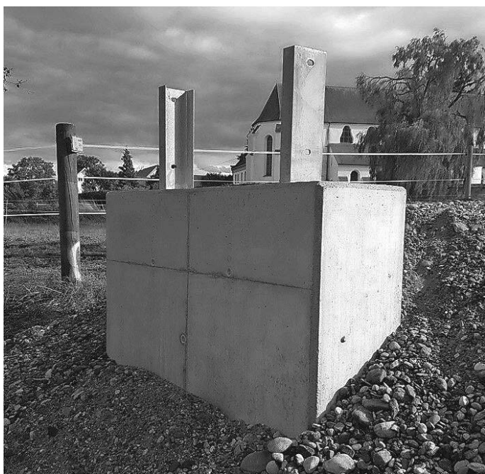
Die Fundamente für den Rotsteg sind fertig.

nur ein gewisses Zeitfenster zur Verfügung. Aus diesem Grund hatte der Gemeinderat diesen Teil des Gesamtprojektes vorab vergeben. Der Auftrag für den späteren Holzsteg kann erst nach der Sicherstellung der Finanzierung vergeben werden. Für ein standsicheres Fundament wurden dabei rund zwei Meter unter dem Flussbett beginnend mehrere Betonringe übereinander verbaut und diese anschließend mit Beton angefüllt. Auf diesen Fundamenten wurden zuletzt noch die Widerlager errichtet, auf denen später die eigentliche Brücke aufgesetzt wird.